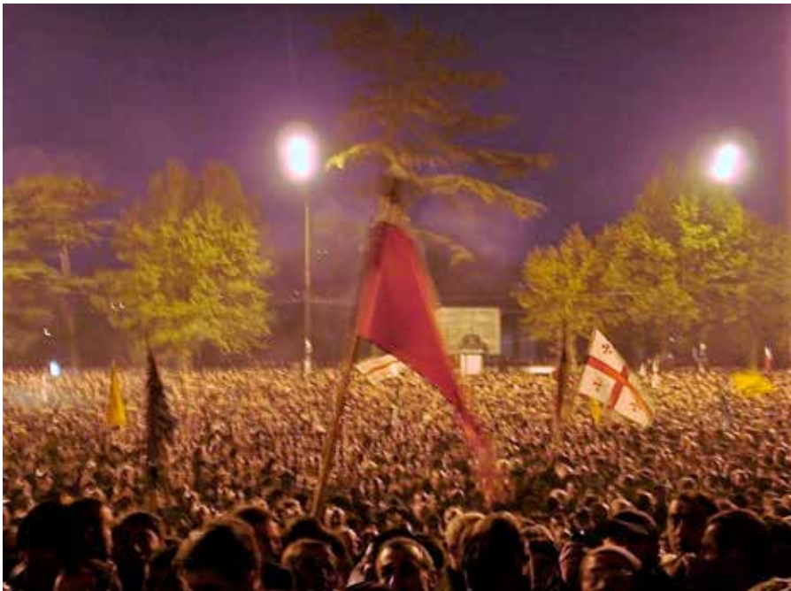
Foto: Rose revolutionen, Tbilisi, 2003. CC BY-SA 3.0 < https://en.wikipedia.org/wiki/Rose_Revolution#/media/File:Georgia,_Tbilisi_-_Rose_Revolution_(2003).jpg >

ikke altid er succesfuldt) altid har været at gøre livet sværere for almindelige borgere, så han eller hun bliver mere åbne overfor idéen om regimeskift og derfor nemmere optræder som et får, der gennes til at handle på disse udefrakommende impulser. Mindre velkendt er imidlertid de mere indirekte, og alligevel mere gængse samt overalt implementerede metoder til at nå målet om konditionering, og dette omgiver ligeledes den magt, som USA har til at påvirke budgetfunktionerne i de stater som er målet, nemlig det indtægtsbeløb de modtager, og hvad de præcist bruger det på.