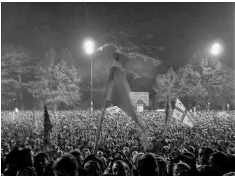
Foto: Rose revolutionen, Tbilisi, 2003. CC BY-SA 3.0 < https://en.wikipedia.org/wiki/Rose_Revolution#/media/File:Georgia,_Tbilisi_-_Rose_Revolution_(2003).jpg >

ikke altid er succesfuldt) altid har været at gøre livet sværere for almindelige borgere, så han eller hun bliver mere åbne overfor idéen om regimeskift og derfor nemmere optræder som et får, der gennes til at handle på disse udefrakommende impulser. Mindre velkendt er imidlertid de mere indirekte, og alligevel mere gængse samt overalt implementerede metoder til at nå målet om konditionering, og dette omgiver ligeledes den magt, som USA har til at påvirke budgetfunktionerne i de stater som er målet, nemlig det indtægtsbeløb de modtager, og hvad de præcist bruger det på.